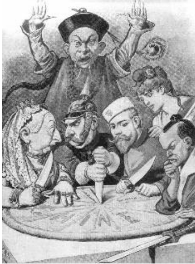
Le Royaume Uni, l'Allemagne, la Russie, la France et le Japon se partagent le contrôle de la Chine

Document 1 : La Chine : le gâteau des rois et des empereurs , Le Petit Journal, 1898.